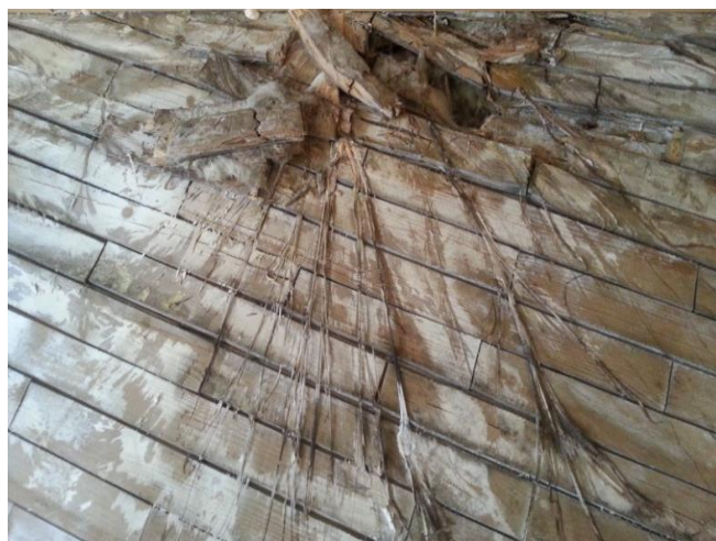
...sur un parquet de chêne entièrement désarticulé (bois pourtant réputé réfractaire à la mэрule !).