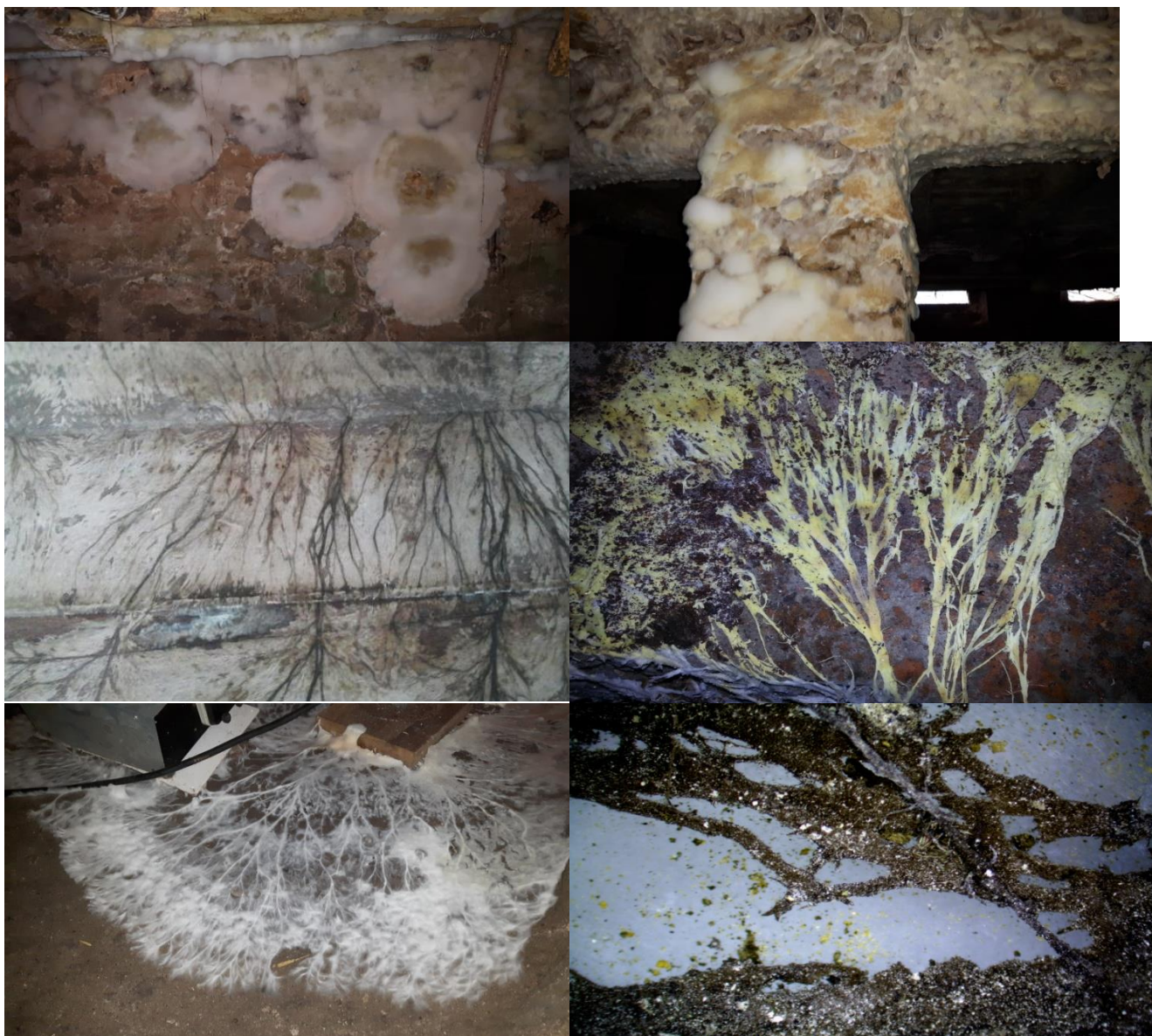
Différents aspects du seul mycélium de la mérule.

Le jeune mycélium passe du blanc pur au jaune, parfois jaune vif ou plus ou moins olivâtre, avec des nuances mauves à violacées par endroits.